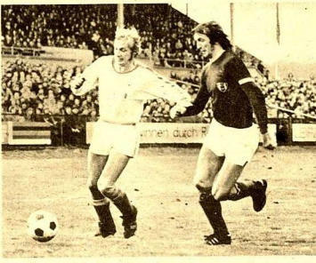
Erst nach der Pause stiegen die Chemiestreiter energiegeladener nach vorn, und da drohte Wismut Aue Gefahr. Weniger versucht sich hier gegen Pohl zu behaupten, kann aber nicht mehr als einen Eckball erwängen.