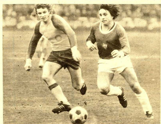
Fritsche vom 1. FCL auf der Verfolgung! Sein Gegenspieler Schulenberg vom BFC Dynamo ist ihm dichtem entwisch. Hoffentlich bleibt das Messiasdiäten am Mittwoch im Tschwitz erspart!